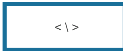
Integration per Code-Snippet